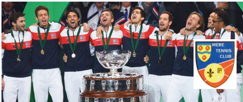
La France remporte sa 10 ème coupe DAVIS fin 2017